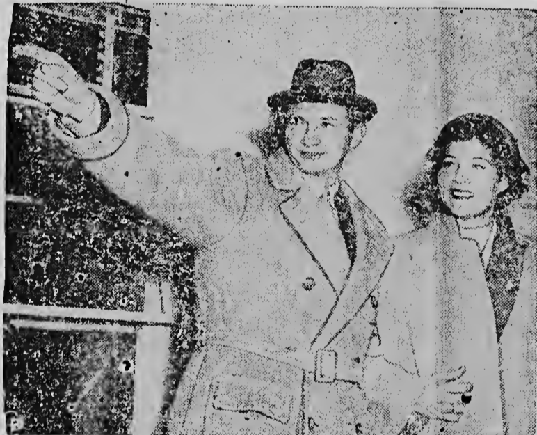
AARTSHERTOG FELIX VAN OOSTENRIJK is in het huwelijk getreden met prinses Anna Arendberg van België. Het jonge paar is thans in Amerika en zal zich in Mexico vestigen. ARZDUQUE FELIX DI AUSTRIA a contrae matrimonio cu princesa Anna Arendberg di Belgica. E pareja joven ta na Estados Unidos actualmente y na lo establece nan mes na Mejico.